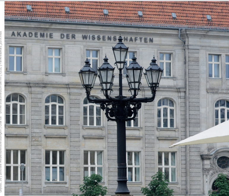
Layout: SCI Zentrale Medienserviceleistungen | Charité - Universitätsmedizin Berlin | CCC | Pankreaskarz_2019.indd